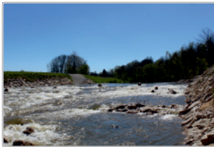
In Sohlgleite umgebautes Wehr