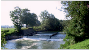
Alter Wehrkörper vor Baubeginn

Donnerstag, 1.6.2017, 14:00 Uhr - 17:00 Uhr, Ammer Grundwehr III bei Unterhausen, westliche Ammerseite beim Altwasser